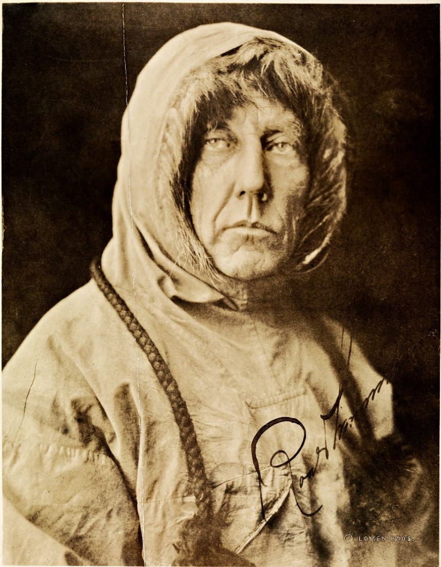
Portrett av Roald Amundsen, Nome, Alaska, ca 1925. Fotograf: Lomen Bros / eier: Nasjonalbiblioteket, bldsa SURAv0055