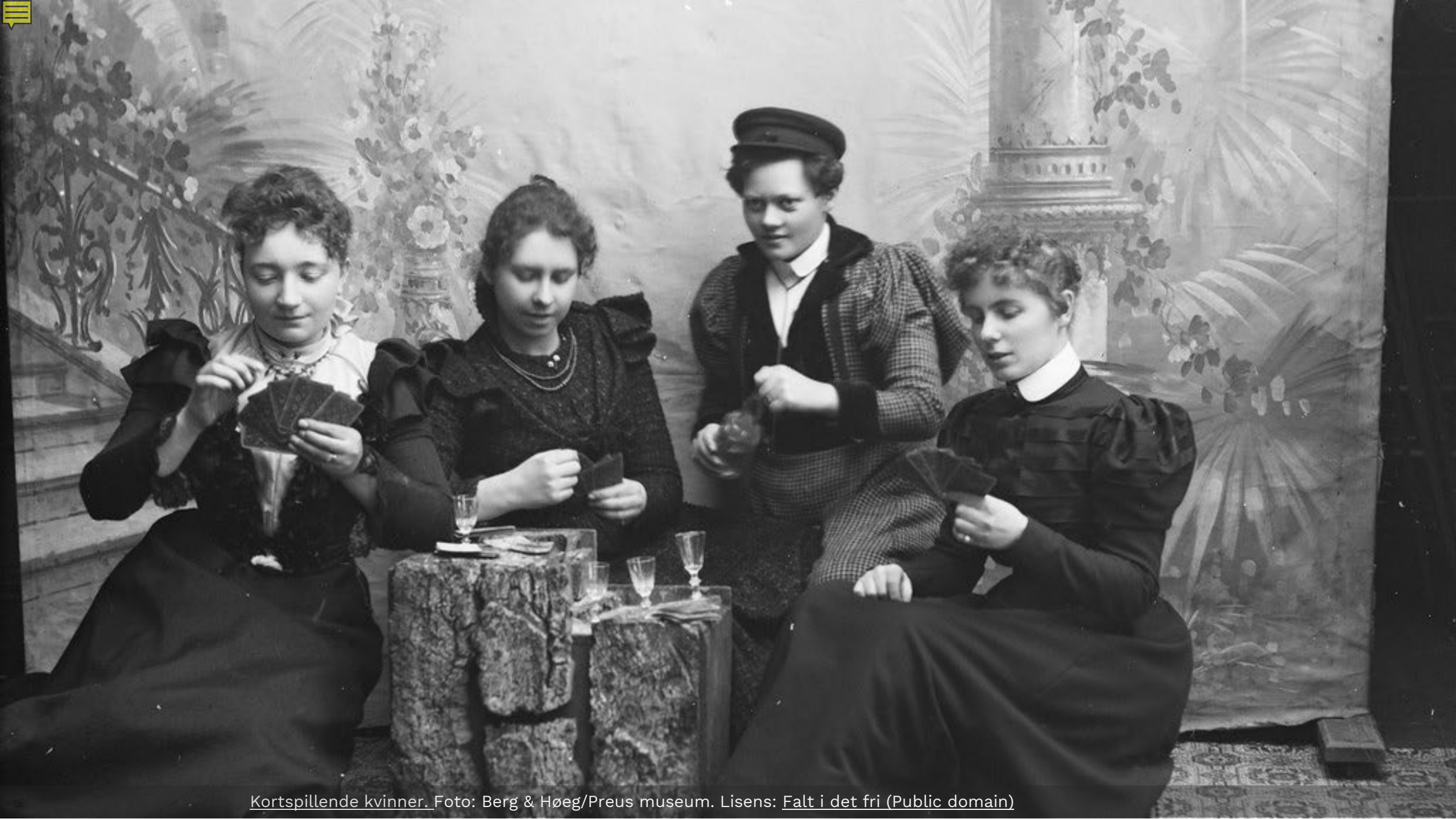
Kortspillende kvinner. Foto: Berg & Høeg/Preus museum. Lisens: Falt i det fri (Public domain)