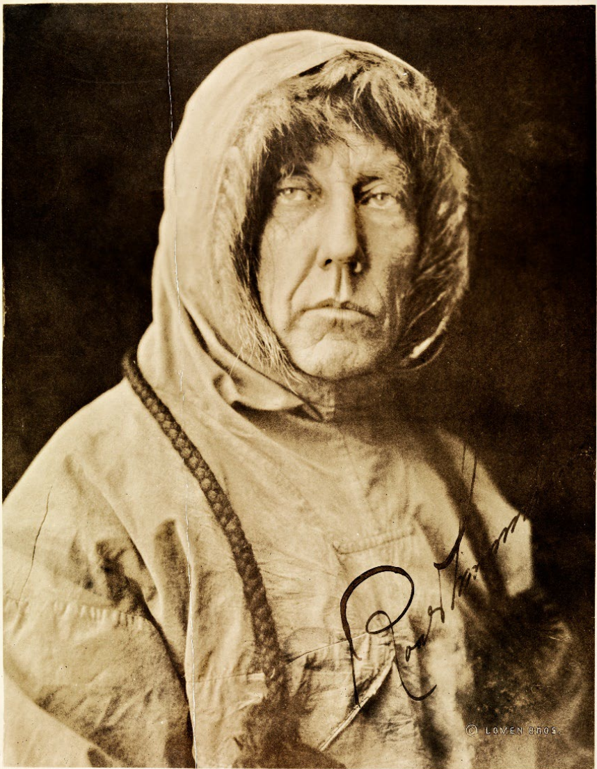
Portrett av Roald Amundsen, Nome, Alaska, ca 1925.