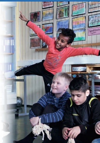
Østbyen skole.

BODØPILOTEN er nå inne i sitt siste år. På konferansen i Kristiansand vil vi presentere smakebiter og resultater fra arbeidet.