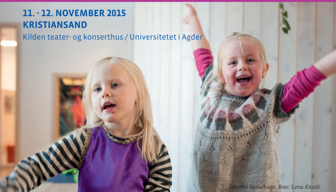
Jakobsli barnehage.

Kilden teater- og konserthus / Universitetet i Agder