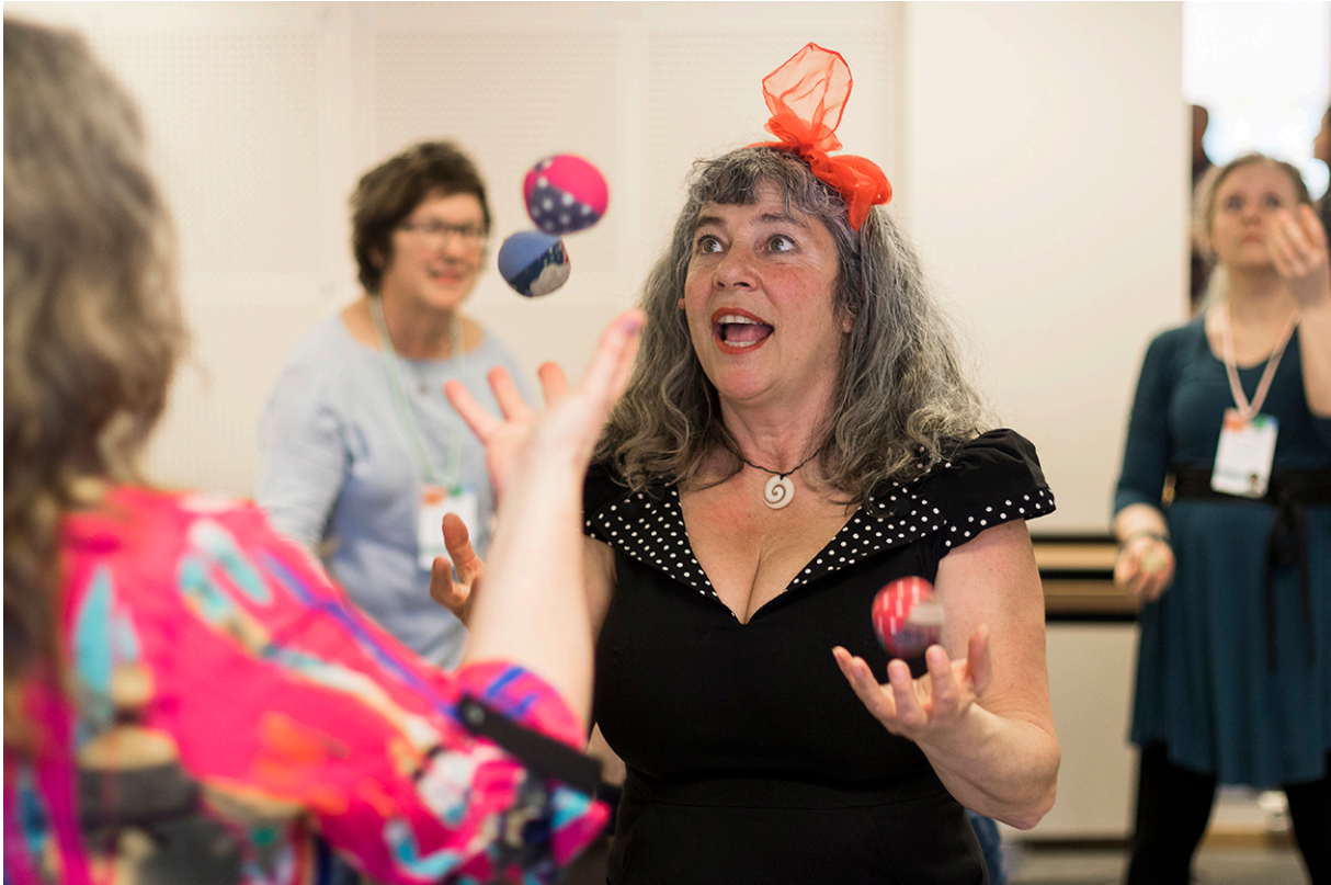
Workshop med Cirkus Sibylla under konferansen Muligheter.

I etterkant av konferansen Muligheter ble det tatt initiativ til en antologi og dette arbeidet er godt i gang. I samarbeid med Statped nord og UiT Norges arktiske universitet fulgte vi også opp tematikken fra konferansen, med et Dialogseminar om inkluderende og bærekraftig utdanning i lys av FN's bærekraftsmål. Spørsmål som ble drøftet var blant annet; Hvordan kan kunstfag og kunstfagdidaktikk fremme inkludering og styrke undervisningen? Seminaret ble avholdt i Harstad i november. På seminaret ble det tatt initiativ til å opprette et nasjonalt nettverk knyttet til forskning på dette feltet. Nettverket har foreløpig fått navnet KunstSkap.