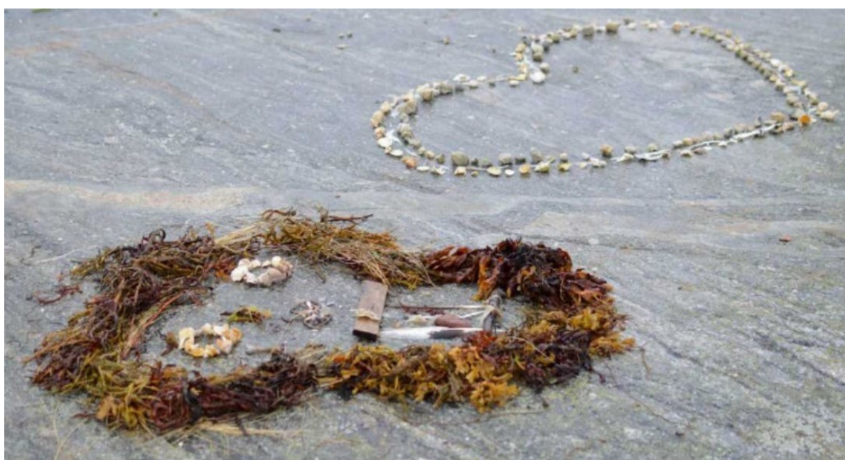
Bærekraftig Landart i samarbeid med Skjerstad oppvekstsenter.

Senterets kompetanse innen kunst- og kulturfag, estetiske læringsprosesser, fagfornyelsen med dybdelæring og tverrfaglige tema samt samisk kunst og kultur er etterspurt av målgruppen og andre aktører. I forbindelse med strategiplanen Skaperglede, engasjement og utforskertrang har regionale kompetansekontor og fylkeskommuner tatt kontakt med senteret. Tema som kreativitet og estetiske læringsprosesser har vært sentralt. Senteret ble invitert til en konferanse om Helsefremmende skoler for å snakke om praktiske og estetiske fag sin rolle i forhold til folkehelse og livsmestring. Etter henvendelse fra Barnehageforum bidrar nå KKS med en artikkel til hver utgave av heftet Vertøykassa , som utgis fire ganger i året. Med disse artiklene bidrar vi til kompetanseheving på barnehagefeltet.