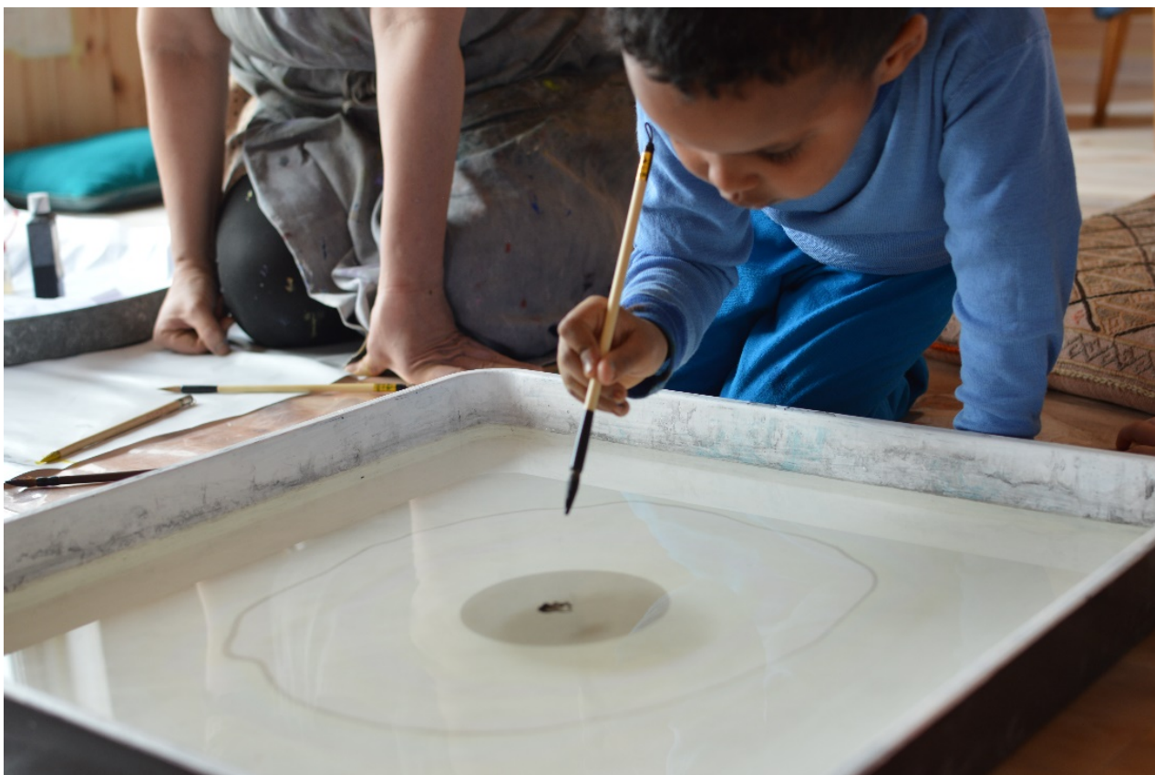
Barnehage på besøk i kunstners atelier.

Barnehager, småskoletrinn og kulturskoler kunne søke deltagelse for utvikling av lokale samarbeidsmodeller i sine kommuner. 42 kommuner søkte om deltagelse. Følgende ble valgt ut av styringsgruppen: Kristiansand, Fredrikstad, Nye Øygarden, Røros, Sunnfjord og Målselv. Kommunene får gjennom deltagelse i prosjektet et kunstmøte og et kompetansehevingstiltak pr. år. Kommunene kom med sine ønsker knyttet til kunstuttrykk og tema. Prosjektgruppen engasjerte kunstnere, utøvere og foredragsholdere, som har bidratt med kompetanseheving og kunstmøter.