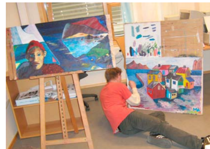
Student i arbeid.

Forutsetningen for å kunne lære å formulere kjennetegn på måloppnåelse og vurdere elevarbeid ut fra det, er at man har nokså omfattende fagkunnskap og egen erfaring fra skapende prosesser. Studentenes bakgrunnskunnskap er svært varierende. I fagdidaktikk i kunst og håndverk ved Høgskolen i Bodø kommer undervisningen om elevvurdering derfor et godt stykke ut i studiet. Inneværende studieår har det vært et mål at studentene skal ha lært å bryte ned kompetansemål, å fordele mål progresjonsmessig på de årene kompetansemålene gjelder for, og å formulere kjennetegn på kompetanse på to og tre nivå. Vanligvis knyttes undervisningen i fagdidaktikk til studentenes samtidige erfaringer fra egne skapende prosesser der de behandler problemstillinger som grunnskolens kompetansemål beskriver. Studenten på bildet nedenfor arbeider med blant annet komposisjon, lys, skygge og volum, som er innholdet i kompetansemålet som brukes som eksempel. At bildene samtidig blir personlige uttrykk, er ikke vanskelig å se.