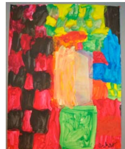
Elevarbeid fjerde trinn. Hva skal vurderes, og hvordan?

Likevel er ikke studentenes uttalelser bare negative. I enkelte tilfeller har heldige fagvalg og reflektert holdning hos studentene ført til at de føler seg godt rustet for å vurdere elevarbeid når de begynner lærergjerningen. En student som avslutter utdanningen sin våren 2009, har i intervju fortalt at både lærerutdanning og praksisopplæring har tatt oppgaven med studentenes vurderingskompetanse alvorlig. Hun har lært om elevvurdering generelt i pedagogikk, og fagene hun har valgt, blant annet kunst og håndverk, har fulgt opp med god undervisning om emnet. Hun kjenner de sentrale retningslinjene og begrepene som brukes. Også i praksis har hun fått delta i vurderingsarbeid, spesielt i form av vurdering med karakter på ungdomstrinnet. Hun er bevisst på at som lærer vil hun drive vurdering for læring, uavhengig av den vurderingskulturen som finnes ved skolen hun arbeider på.