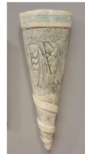
Studentarbeid, lærerutdanningen. Hva skal vurderes, og hvordan?