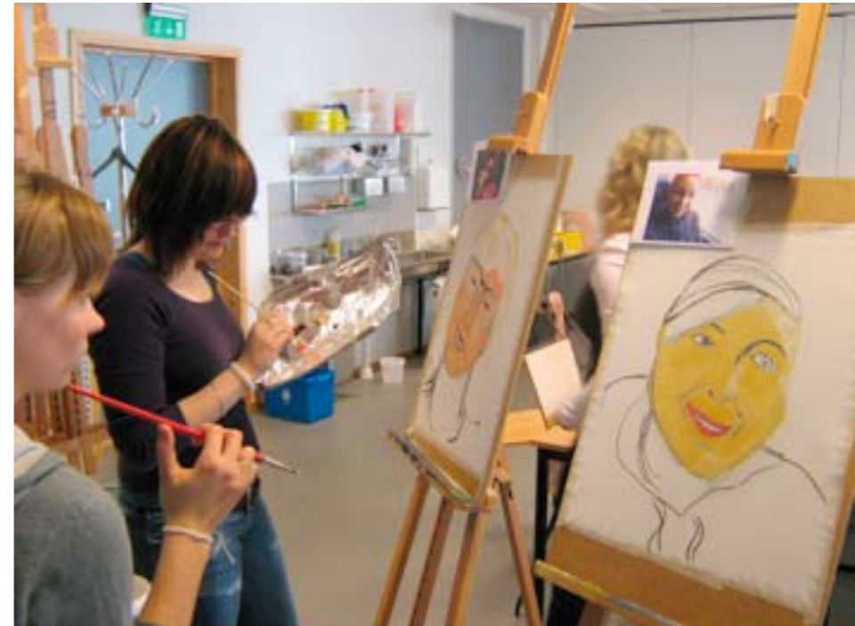
Studenter arbeider med selvportrett.