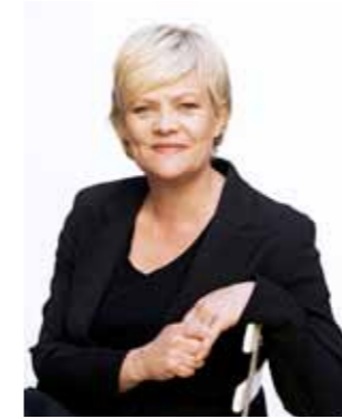
Kristin Halvorsen Kunnskapsminister

Barnehageprisen er med på å lyfte fram barnehagen som ein viktig kulturarena, der alle barn får erfare undring, glede og meistring gjennom ulike kulturelle uttrykk.