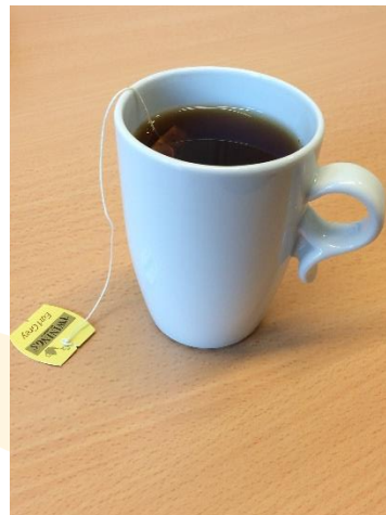
Kopper og kar (uten innhold)