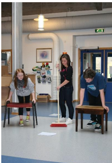
Koster og krakker

Elevene/gruppene har så sin egen øving mens lærer går rundt og veileder. Husk at en stor del av ansvaret her ligger på elevenes egen læring. Lærerne må stole på at elevene gjør det de skal. Her er det også viktig at lærer tåler litt tilløp til kaos og kreativitet.